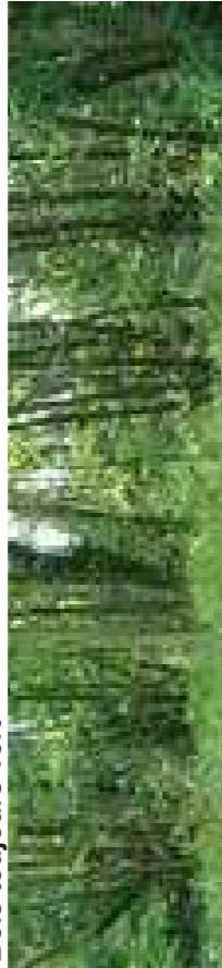
Saulaie - Aulnaie