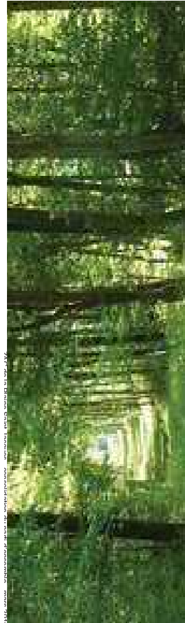
Chênaie - charmaie