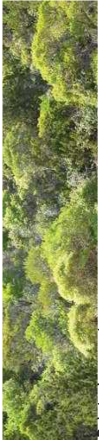
Bois toujours vert