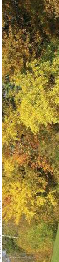
Fruitière et champêtre