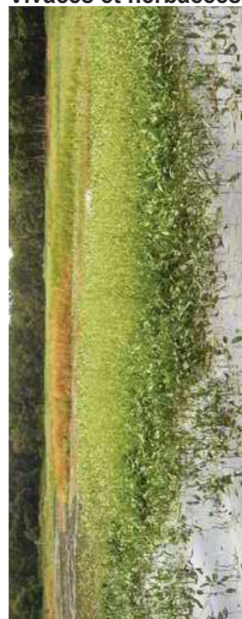
Aquatiques hélophiles et surface d'eau permanente