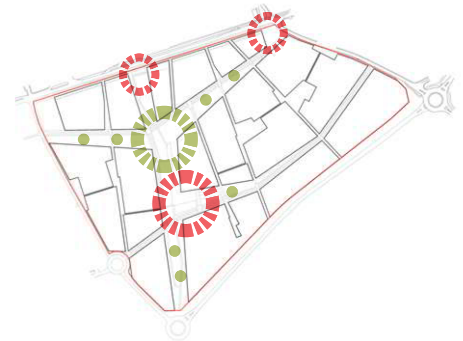
ANIMATION ET ÉCHANGES