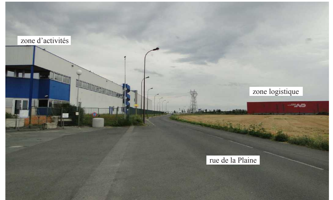
Des interfaces à questionner, un paysage à recréer