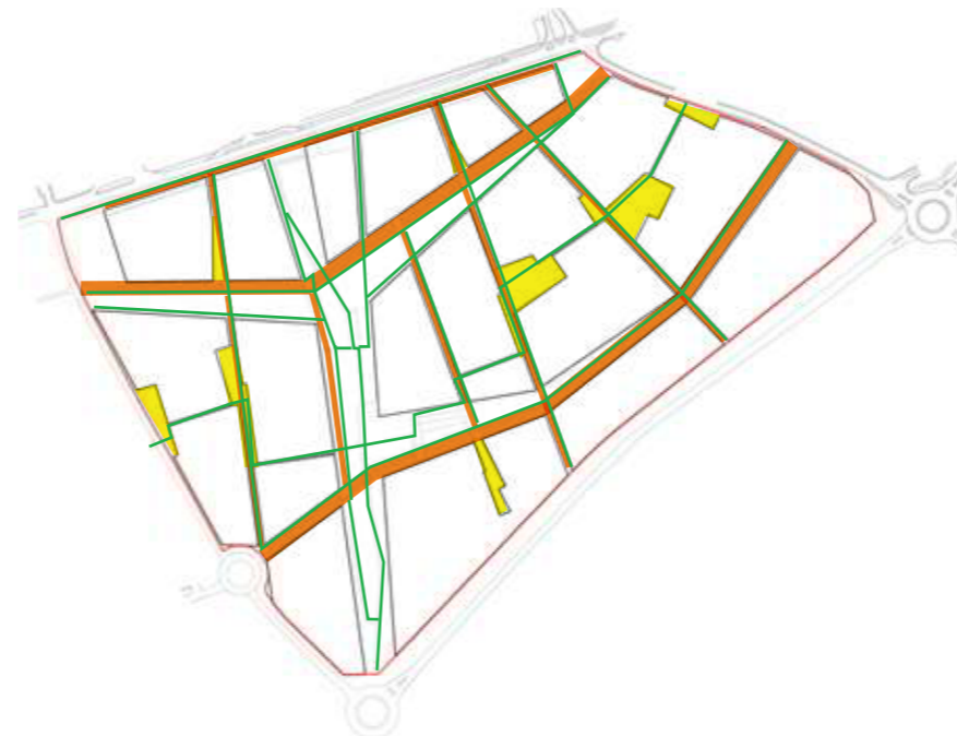
MOBILITÉS ET DESSERTE