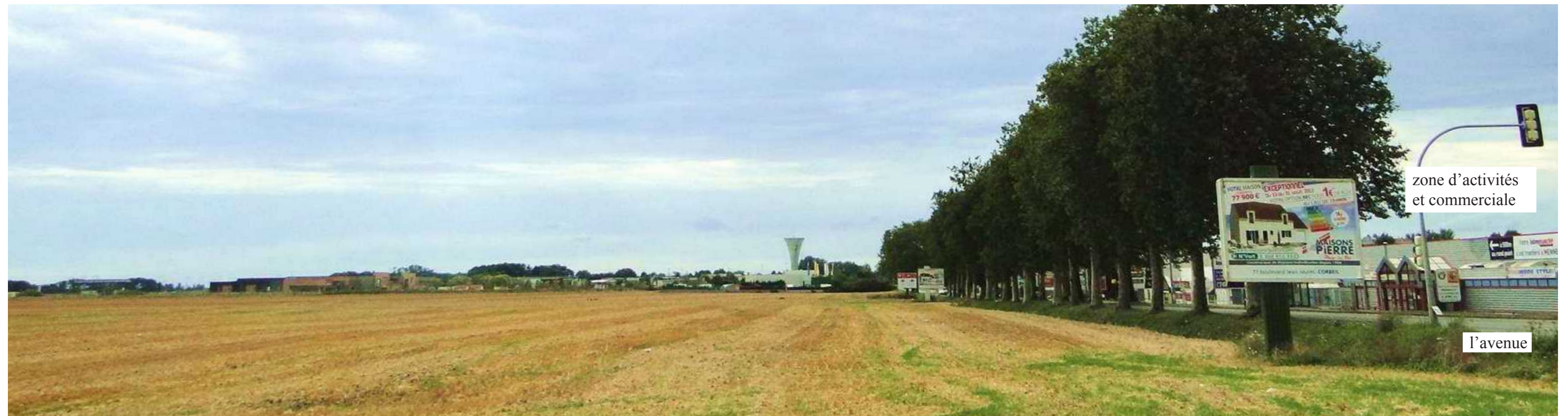
La plaine Saint-Jacques, entre ville et campagne, un espace ouvert cadré par l'urbanisation